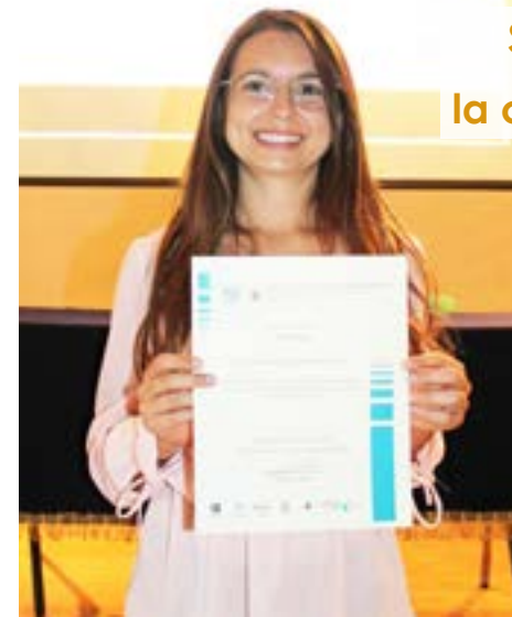
Por Josué Bonilla

Se presenta en nuestro plantel la caravana “Mexicanas del futuro.”